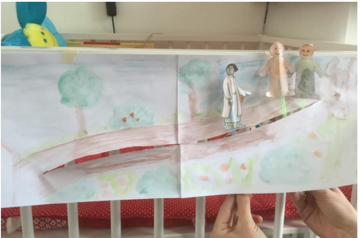
Voorbeeld gevonden op internet.

Teken op een wit papier (of twee papieren aan elkaar als je een langere weg wil maken) een weg, aan de ene kant van de weg kun je dan Jeruzalem tekenen en aan de andere kant van de weg kun je Emmaüs tekenen. Met een schaar knip je in de getekende weg een spleet (let op dat je niet je hele tekening doormidden knipt, dus alleen knippen van Jeruzalem naar Emmaüs). Teken op een ander papier drie poppetjes: de twee Emmaüsgangers en Jezus, knip ze uit en plak ze op de (ijs)stokjes. Eén poppetje per stokje. Nu kun je de poppetjes via de achterkant van je tekening door de geknipte spleet steken en kun je de poppetjes heen en weer laten lopen.